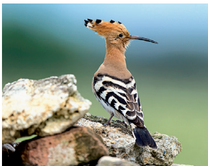
Michael Gerber / birds-online.ch