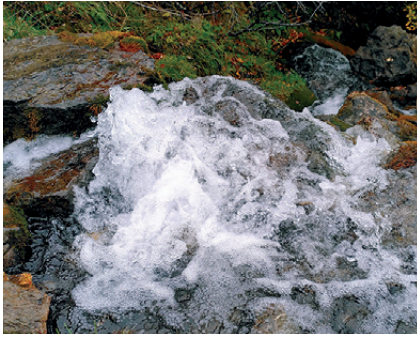
Pro Natura Luzern